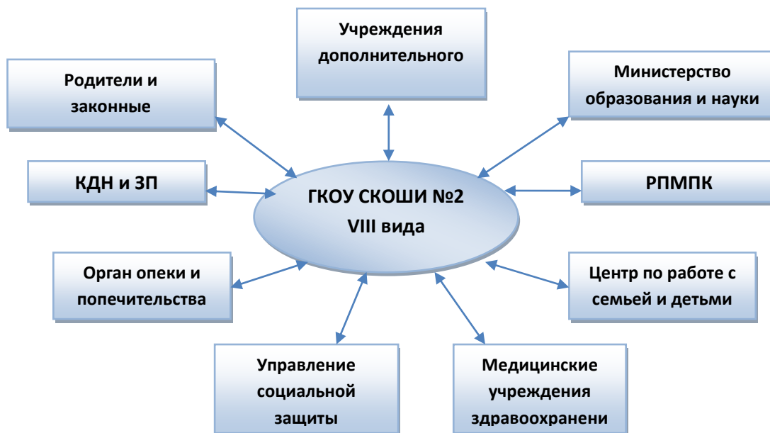
Рис. 1. Взаимодействие ОУ

Одно из важных направлений социальной работы – это взаимодействие с общественными организациями и проведение совместных мероприятий, акции и т.д. (рис. 1).