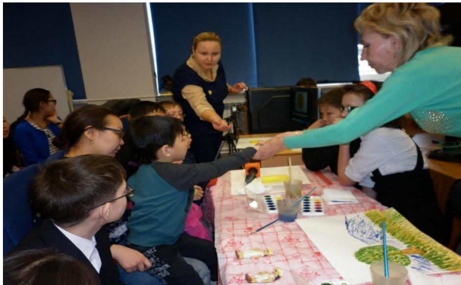
Мастер-класс, проводимый в Национальной библиотеке РБ.

Практические занятия в основном представлены мастер-классами и направлены на формирование профессиональных практических действий (умений) и развитие опыта коррекционно-развивающей деятельности в области социализации детей с нарушениями в развитии.